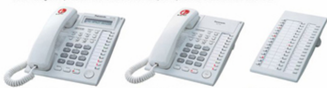
■ KX-T7730 LCD, Speakerphone ■ KX-T7750 Monitor ■ KX-T7740 DSS Console

* Dibutuhkan card tambahan. Stasiun hubungi dealer perusahaan telekomunikasi untuk konfirmasi apakah layanan caller ID sudah tersedia di daerah anda.